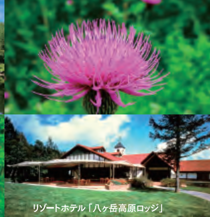
リゾートホテル「八ヶ岳高原ロッジ」