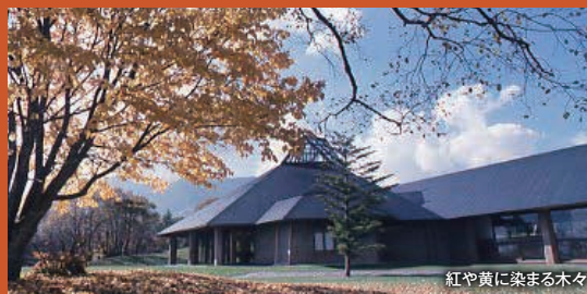
紅や黄に染まる木々