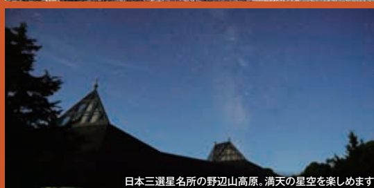
日本三選星名所の野辺山高原。満天の星空を楽しめます